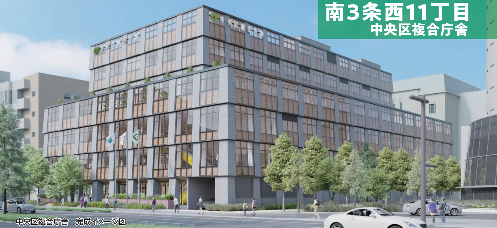
中央区複合庁舎 完成イメージ図